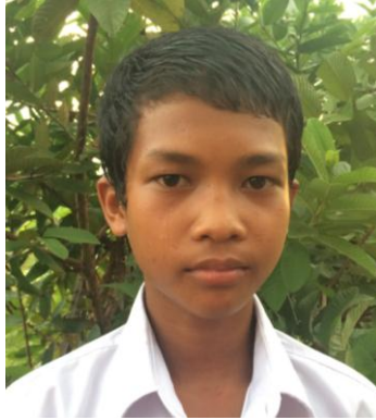
លេខ: ០២១/២០១៤ វ.ក.យ

វត្តក្រយា ឃុំក្រយា ស្រុកសន្ទុក ខេត្តកំពង់ធំ