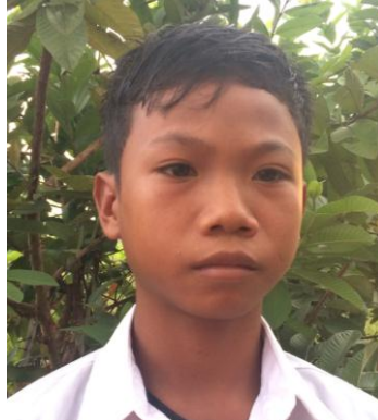
លេខ: ០២៤/២០១៤ វ.ក.យ

វត្តក្រយា ឃុំក្រយា ស្រុកសន្ទុក ខេត្តកំពង់ធំ