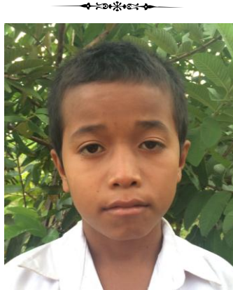
លេខ: ០១៤/២០១៤ វ.ក.យ

វត្តក្រយា ឃុំក្រយា ស្រុកសន្ទុក ខេត្តកំពង់ធំ